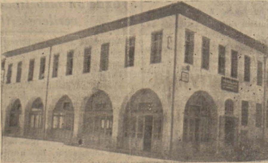
Yeniden tamir ve ıslâh edilen Vakıflara ait Liman İhisar şirketi binası

Senelerdenberi imar edilmiyen binanın güzel bir şekilde sok-